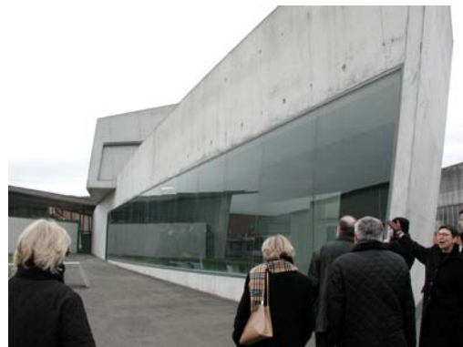
Z. HADID - Station de pompier Vitra, Allemagne - 1993

Lorsque Zaha Hadid remporte le concours pour le projet du Peak à Hong Kong en 1983, elle déclare que l'architecture, pour être révolutionnaire, doit pousser