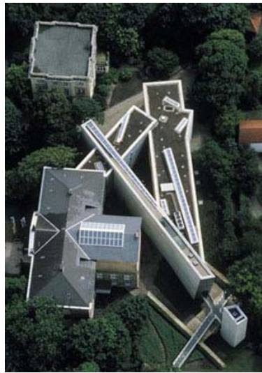
D. LIBESKIND - Félix Nussbaum Haus - 1998