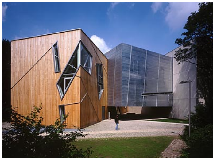
D. LIBESKIND - Félix Nussbaum Haus - 1998

Il n'y a pas de rapport entre la structure d'une photo et celle d'un bâtiment. Toute image ne peut être mise en volume sans création additionnelle. Projeter un dessin en trois dimensions sans l'apport géométrique, c'est mettre au monde un enfant sans colonne vertébrale, c'est construire des phrases sans règles de grammaire. L'élimination de cette structure permet de faire n'importe quoi et propose un accès à une liberté créative sans limites.