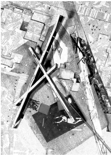
D. LIBESKIND - City edge, Berlin - 1987

les limites de l'ingénierie, soit de la science. Elle conçoit des volumes en équilibre au bout d'une falaise surplombant la ville, genre de gratte-ciel horizontal. En 1993, elle construit un de ses premiers bâtiments, la station de pompier Vitra (maintenant recyclée en centre d'exposition) à Weil am Rhein en Allemagne. Sorte de curiosité architecturale tirée d'un rêve, dire que c'est une station de pompier pose une énigme plus qu'une vérité. L'effet tectonique du verre et du béton ancre le bâtiment et lui donne une présence assurée. Cependant, de son volume, il est difficile d'en conserver une impression reconstructible. Ce bâtiment m'apparaît comme la persévérance de transgresser le réel afin d'imposer une idée non médiatisée par le retour de son effet. C'est un fantasme réalisé à une échelle qui fait chuter l'idée d'origine. L'usage de ces espaces, à long terme, ne tient pas face au principe de réalité. Je pose que ce volume refoule peu et qu'en contrepartie, il offre peu comme retour du refoulé. Il est étrange et demeure étranger, étranger à toute culture qui tente de faire lien social, mais il est tout à fait remarquable comme délire où il demeure toujours excentrique, c'est-à-dire hors centre. Il n'offre aucune place au sujet.