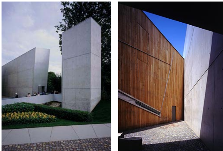
D. LIBESKIND - Félix Nussbaum Haus - 1998

Je pose l'hypothèse suivante : Libeskind est l'effet d'un discours. Il n'est pas le seul à avoir donné cette expression à un savoir qu'il écrit en espace. Il y a dans son projet des éléments, un tracé en plan et en coupe, une épure géométrique qui se retrouve dans d'autres projets d'architecture. Ces projets définissent une manière de faire qui se répète et cherchent à cerner un savoir soi-disant nouveau. Ceux qui donnent forme à ce savoir le placent comme une réponse possible à ce qui manque, à ce qui leur manque dans une société où l'autre absent réapparaît dans les média, sous la forme d'une image idéale à laquelle l'auteur s'identifie. C'est le mythe de la communication.